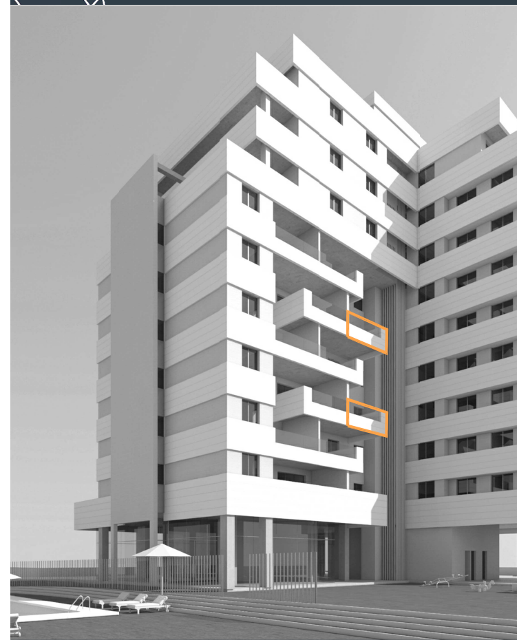
VIVIENDA TIPO D